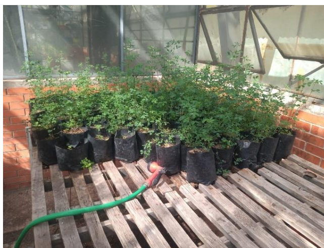
Figura 2. Plantas de alfalfa en maceta.

En bolsas negras de plástico perforadas con medidas de 20 X 20 cm se cultivaron 20 plantas de alfalfa variedad júpiter Figura 2, a las cuales se les midió la tasa de fotosíntesis neta ( \mu\text{mol CO}_2 \text{m}^{-2} \text{s}^{-1} ) a los 100 días después de la siembra, en el laboratorio de forrajes del Colegio de Postgraduados.