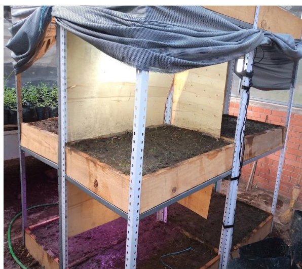
Figura 1. Estante con tres divisiones de 80 x 60 cm

El experimento fue establecido en cuatro estantes de una altura de 2.50 m con tres divisiones, cada división con dimensiones de 80 cm de largo por 60 cm de ancho, en cada una se colocó una base de 20 cm de alto con madera donde se agregó 70% suelo franco arenoso, con pH 8.2 y 4.1% de materia orgánica extraída del área experimental conocida como predio nuevo y 30% de composta de heces de borrego y cabra extraída del campo experimental CCIT del Colegio de Postgraduados. Se utilizaron semillas de alfalfa variedad Júpiter a una densidad de 4 g m -2 de semilla pura germinable (Figura 1).