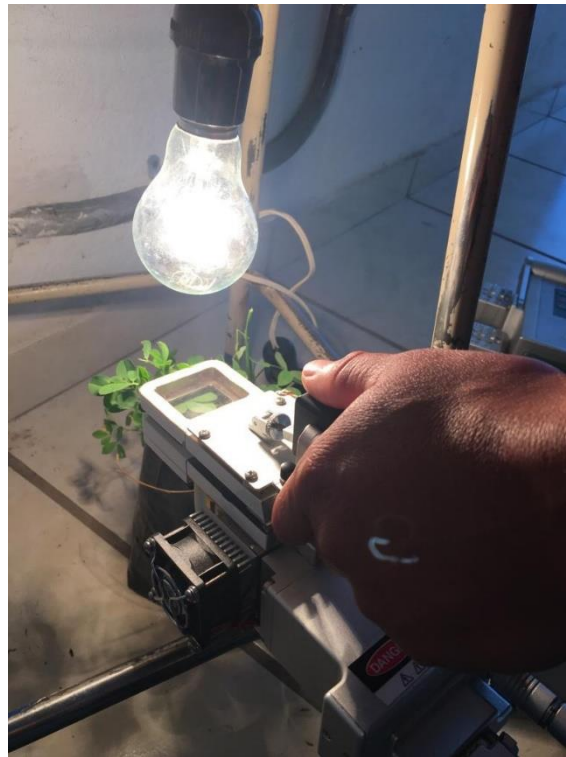
Figura 3. Medición con IRGA en planta de alfalfa.

Se tomaron lecturas con un sistema portátil medidor de fotosíntesis IRGA (Infra Red Gases Analyzer, USA) anteriormente calibrado, colocando 5 hojas por repetición para hacer la medición, lo que permitió deducir la fotosíntesis en las plantas de alfalfa con diferentes fuentes de luz. La tasa de fotosíntesis ( \mu\text{mol CO}_2 \text{ m}^{-2} \text{ s}^{-1} ), se midió al colocar una hoja completamente expandida dentro de la cámara de asimilación del IRGA, donde las mediciones se basan en las diferencias de concentración de \text{CO}_2 que entra y sale en una cámara cerrada en la que se encuentra la hoja expuesta (Figura 3).