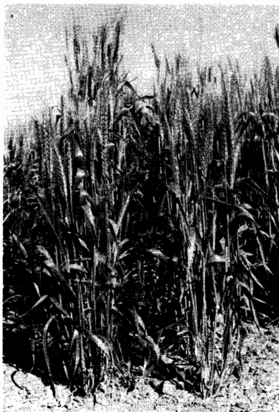
FIGURA 3. Plantas de triticales octaploide en la primera generación posterior al doblamiento cromosómico logrado por el tratamiento de plántulas con colchicina. Las plantas son normales y con espigas grandes. (CIANO, Cd. Obregón, Son., ciclo 1968-1969.)