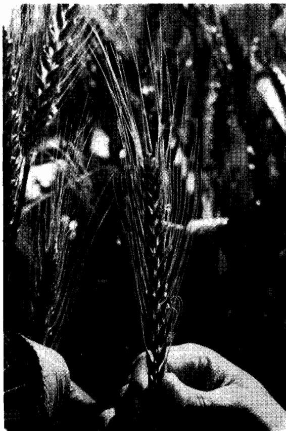
FIGURA 2. Espiga de triticales octaploide fértil y estable. (CIANO, Cd. Obregón, Son., ciclo 1968-1969.)

La identificación de las plantas híbridas es relativamente fácil, ya que su fenotipo es muy característico y diferente a los de trigo y centeno (Figuras 2 y 3); por otra parte, todas aquellas plantas que tuvieron la apariencia del híbrido y espigas con grano, era indiscutiblemente que habían sido afectadas por la colchicina, doblándoles el número cromosómico. Sin embargo y con el propósito de tener una mayor seguridad y también de conocer el grado de poliploidía de las plantas críticas, se procedió a muestrear espigas de la segunda generación después del tratamiento. El objetivo fue el de observar la meiosis de 3 a 4 plantas, por lo menos, de cada uno de los 77 surcos sembrados en el verano de 1968 en Chapingo, para determinar el número de cromosomas, y de esta manera conocer exactamente si era el anfidiplóide o simplemente autopolinizaciones. El método utilizado para la observación de los cromosomas meióticos fue el del "aplastado" con carmín acético.