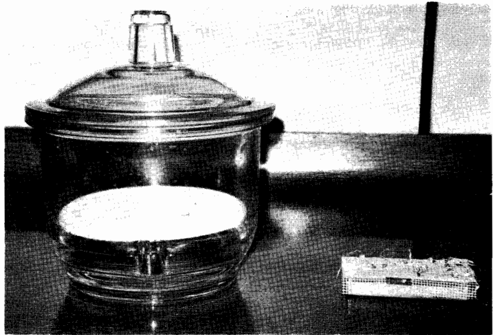
FIGURA 1. A la derecha puede apreciarse cómo se colocaron las plántulas (de la semilla F_1 de triticale octaploide), con el hipocotilo en contacto con la solución de colchicina y las raíces quedaron en el aire. A la izquierda, la cámara húmeda utilizada.

inmediatamente después se procedió a descubrir el cuello de las mismas con un chorro de agua para eliminar la tierra que las cubría. Luego se cubrió ajustadamente con algodón a todos los hijuelos o tallos de la planta, tratando que el algodón quedara lo más cerca posible del punto de crecimiento, o sea, próximo al cuello del tallo. Las plantas se introdujeron a una cámara húmeda metálica completamente oscura, y allí se empaparon los algodones con una solución de colchicina al 1%. Permanecieron en la oscuridad por espacio de 48 horas, lapso durante el cual sólo se destapaba la cámara húmeda a intervalos de 10 a 12 horas para checar que los algodones estuvieran bien humedecidos, y si esto no sucedía se volvía a aplicar la solución de colchicina con un gotero. Después de esto se sacaron las macetas, se cubrió la zona del cuello del tallo con tierra y se dejaron en el invernadero.