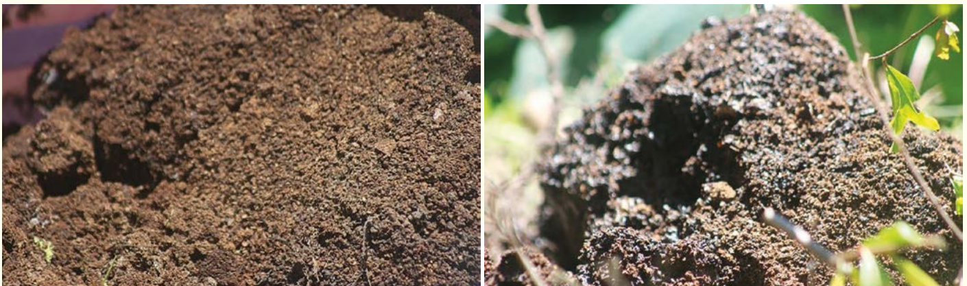
Figura 2. Borra de café ( Coffea arabica L.) en proceso de compostaje.

los residuos de cal suspendida que fueron usados en la cocción.