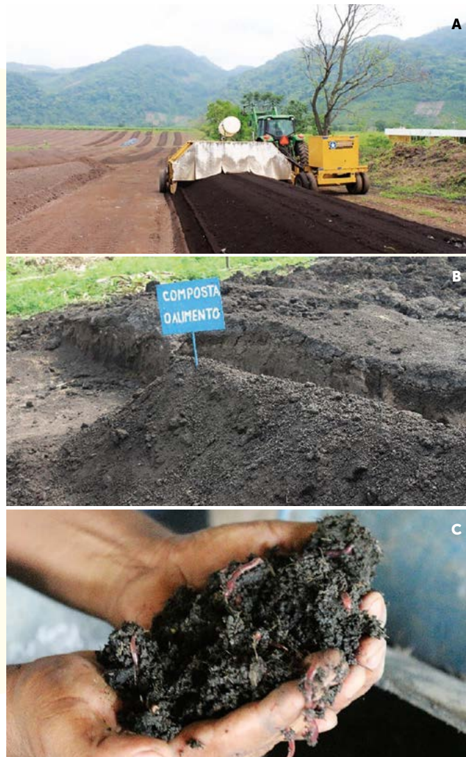
Figura 1. A: Producción de composta a partir de la cachaza. B-C: Producción de vermicomposta a partir de cachaza.

La producción de este residuo es constante como parte de la cadena productiva, luego entonces el reto es encontrar y diseñar al-