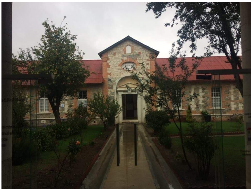
Fotografía 13. Centro Cultural Nicolás Zavala y Museo de Medicina Laboral.