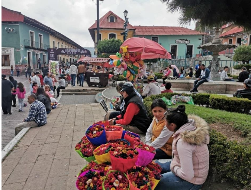
Fotografía 1. Centro de Mineral del Monte.