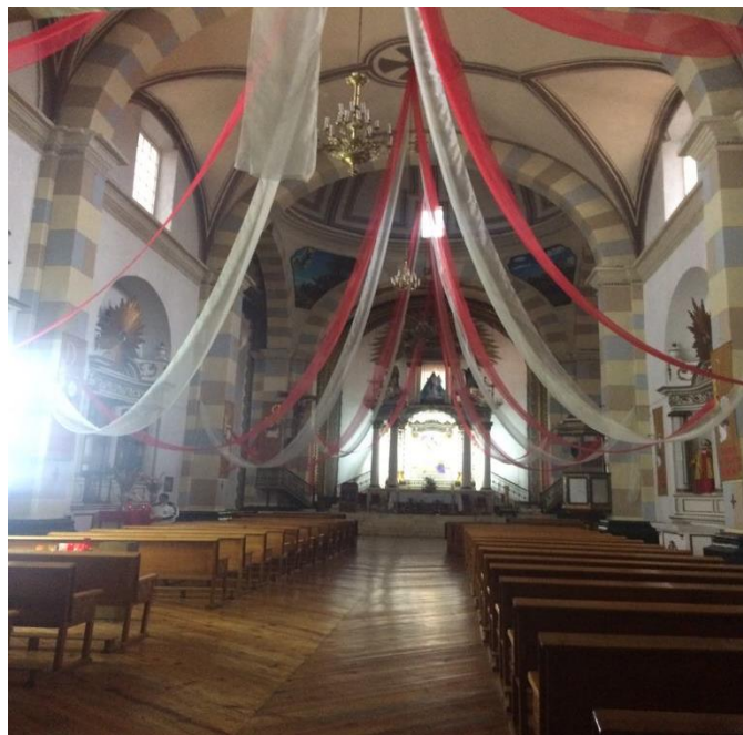
Fotografía 2. Templo Nuestra señora del Rosario