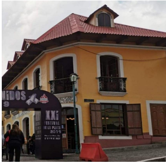
Fotografía 11. Tienda de Pastes más antigua “Billares Casino Don Fidel”.