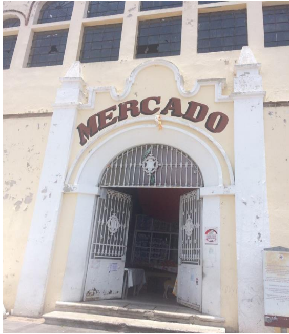
Fotografía 5. Mercado.