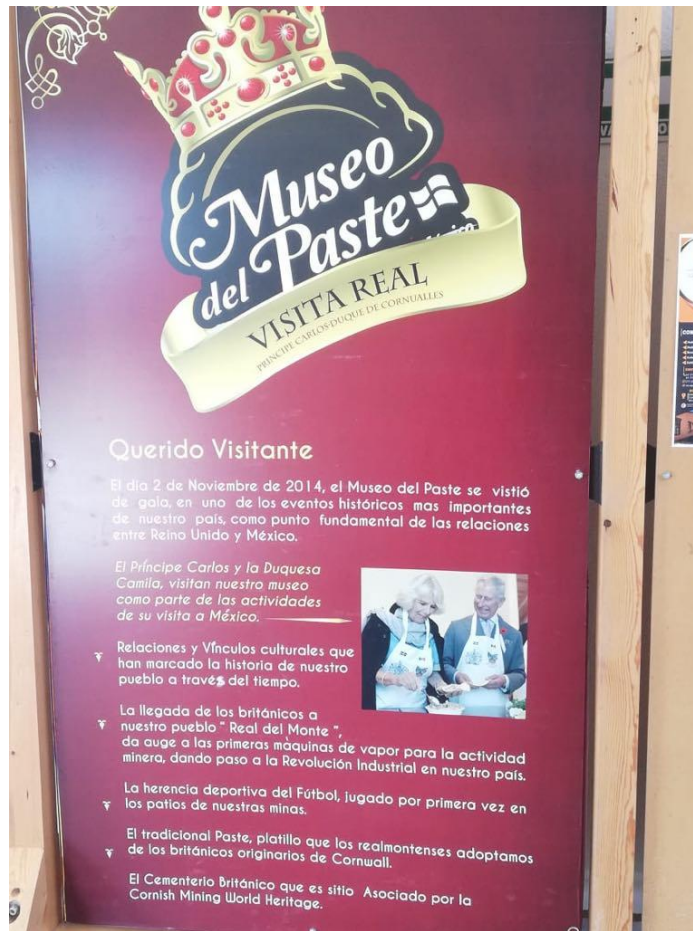
Fotografía 19. Museo del Paste, una Visita Real.