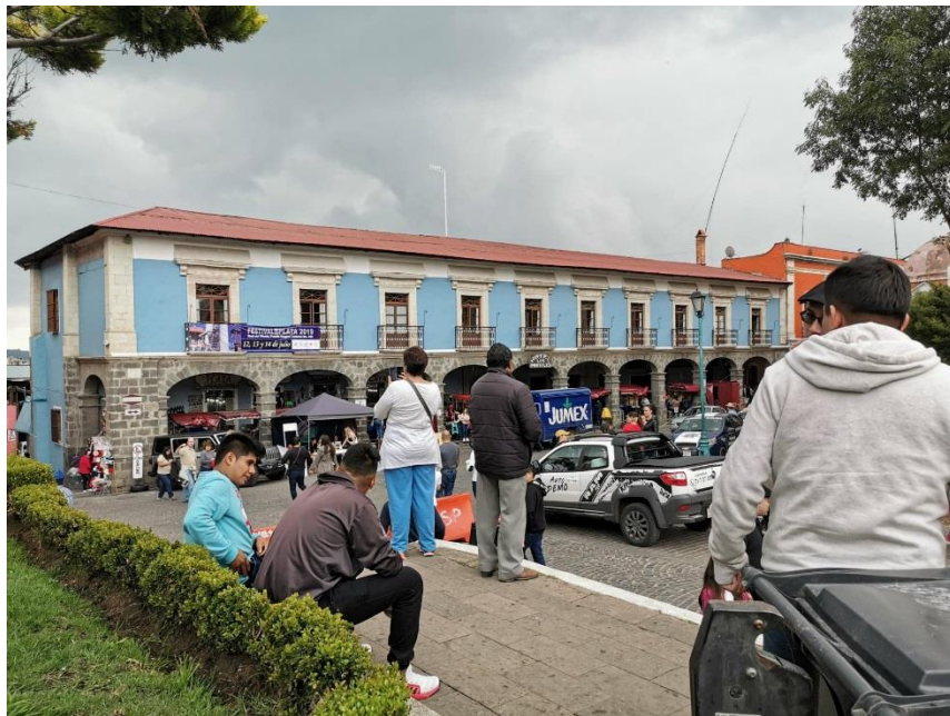
Fotografía 4. Mercado de artesanías “Los Portales”.