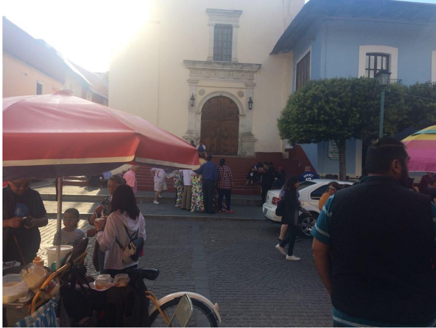
Fotografía 3. Santuario del Señor de Zelontla “Cristo de los mineros”.