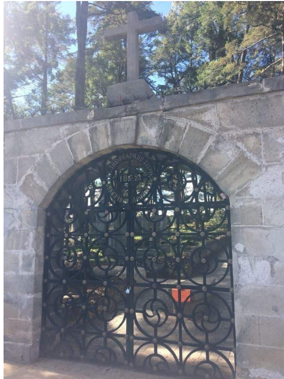
Fotografía 21. Entrada al Panteón Inglés.