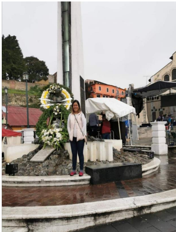
Fotografía 8. Explanada del Monumento al Minero, julio 2019, Marisol Luna Carrillo, autora de esta tesis.