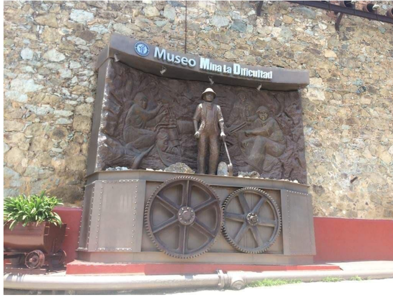
Fotografía 15. Entrada al Museo de Sitio y Centro de Interpretación Mina La Dificultad.