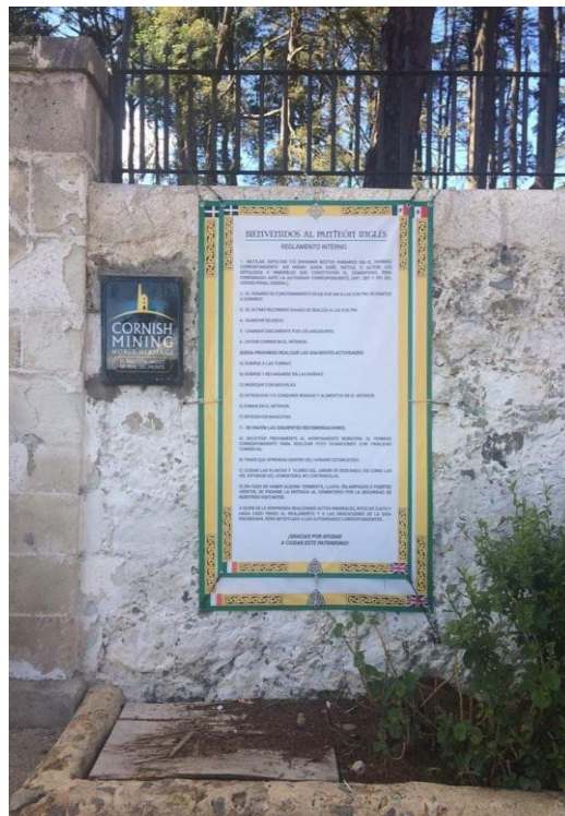
Fotografía 22. Reglamento del Panteón Inglés.