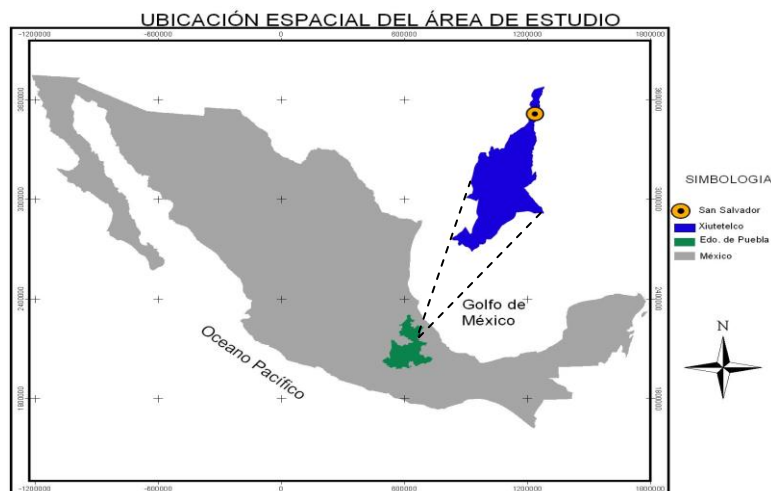
Figura 1. Localización del municipio de Xiutetelco, Puebla

El municipio de Xiutetelco se localiza en la parte Noreste del estado de Puebla. Sus coordenadas geográficas son los paralelos 19^{\circ} 37' 30'' y 19^{\circ} 56' 42'' de latitud norte y 97^{\circ} 17' 00'' y 97^{\circ} 24' 30'' de longitud occidental (Figura 1). El relieve del municipio es en general montañoso; al sur se presentan algunas depresiones y el cerro bastante amplio de la Viola que señala la máxima altura del territorio y el declive constante hacia el sur y hacia el norte, el paisaje del municipio es ondulado. Limita al norte con Hueytamalco, al este con el Estado de Veracruz, al sur con Tepeyahualco y al Oeste con Teziutlán y Chignautla, Puebla. Tiene una superficie de 93.12 \text{ Km}^2 que lo ubica en el lugar número 129 con respecto a los demás municipios del Estado (INAFED, 2010).